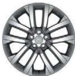
21" 5-RAMIENNE 'WZÓR 5123' 3