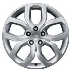
19" 5-RAMIENNE 'WZÓR 5021' 1