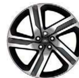
22" 5-RAMIENNE 'WZÓR 5124' DARK GREY & DIAMOND TURNED 4