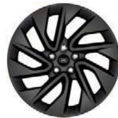
20" 5-RAMIENNE 'WZÓR 5122' SATIN DARK GREY 2