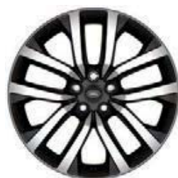
21" 5-RAMIENNE 'WZÓR 5123' DARK GREY & DIAMOND TURNED 3