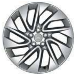
20" 5-RAMIENNE 'WZÓR 5122' 2