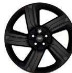
22" 5-RAMIENNE 'WZÓR 5124' GLOSS BLACK 4