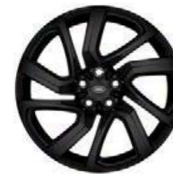
21" 5-RAMIENNE 'WZÓR 5025' GLOSS BLACK 3