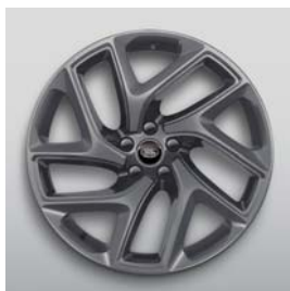
22", SV BESPOKE, 5-RAMIENNE, DIAMOND TURNED / GLOSS DARK GREY, (WZÓR 5131)