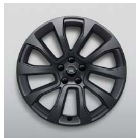
21", 5-RAMIENNE, SATIN DARK GREY, (WZÓR 5126)