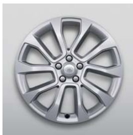
21", 5-RAMIENNE, (WZÓR 5126)