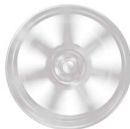
22", 10-RAMIENNE, DIAMOND TURNED/ GLOSS DARK GREY (WZÓR 1080)