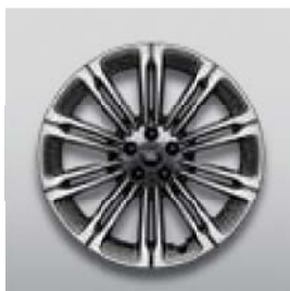
23", 10-RAMIENNE, (WZÓR 1075), DIAMOND TURNED / DARK GREY**