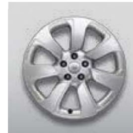
20", 7-RAMIENNE, (WZÓR 7020)*