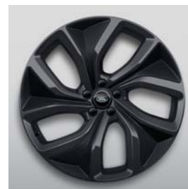
23", SV BESPOKE, 10-RAMIENNE, DARK GREY, (WZÓR 5128)**