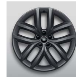
22", 5-RAMIENNE, SATIN DARK GREY, (WZÓR 5127)