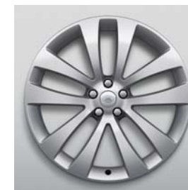
23", 5-RAMIENNE, (WZÓR 5135)**