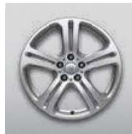
20", 5-RAMIENNE, (WZÓR 5134)*