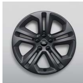
20", 5-RAMIENNE, SATIN DARK GREY (WZÓR 5125)*