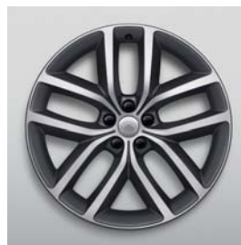
22", 5-RAMIENNE, DIAMOND TURNED / SATIN DARK GREY, (WZÓR 5127)