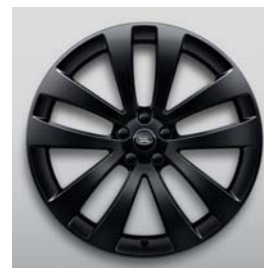
23", 5-RAMIENNE, GLOSS BLACK, (WZÓR 5135)**