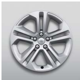
20", 5-RAMIENNE, (WZÓR 5125)*